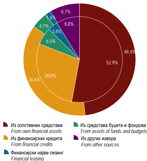
Г-10.3. Исплате за инвестиције по основним изворима финансирања у 2004. и 2012. Financing of gross fixed capital formation by main sources in 2004 and 2012