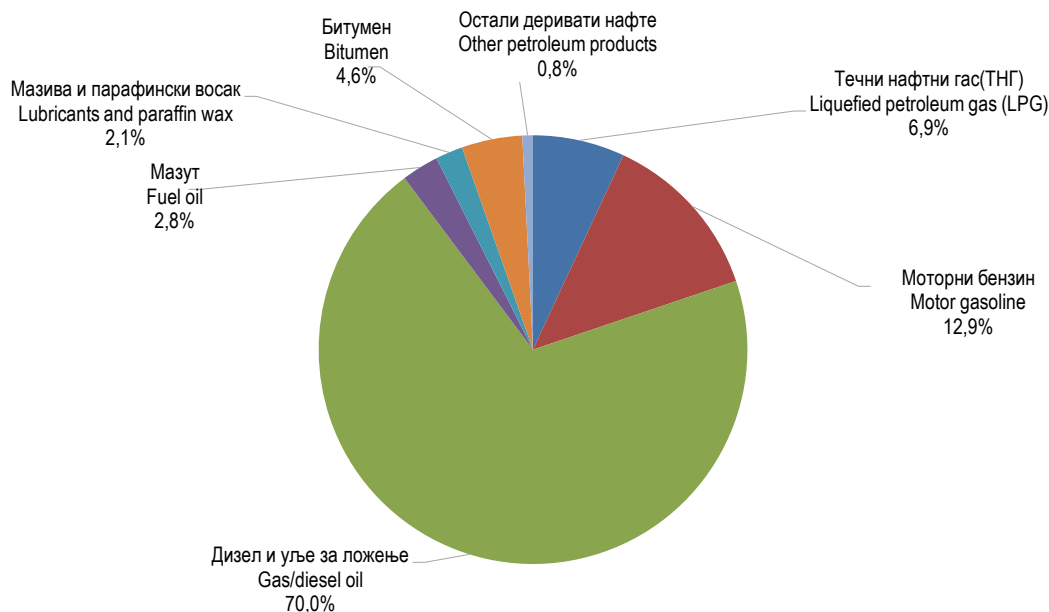
Графикон 1. Енергија расположива за финалну потрошњу, 2021 Graph 1. Energy available for final consumption, 2021