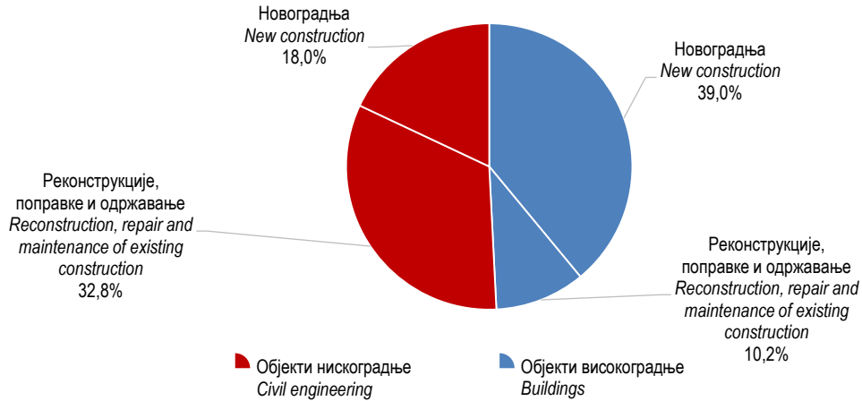
Графикон 2. Структура извршених ефективних часова према врсти радова, I тромјесечје 2020. Graph 2. Composition of performed effective hours by type of work, 1 st quarter 2020