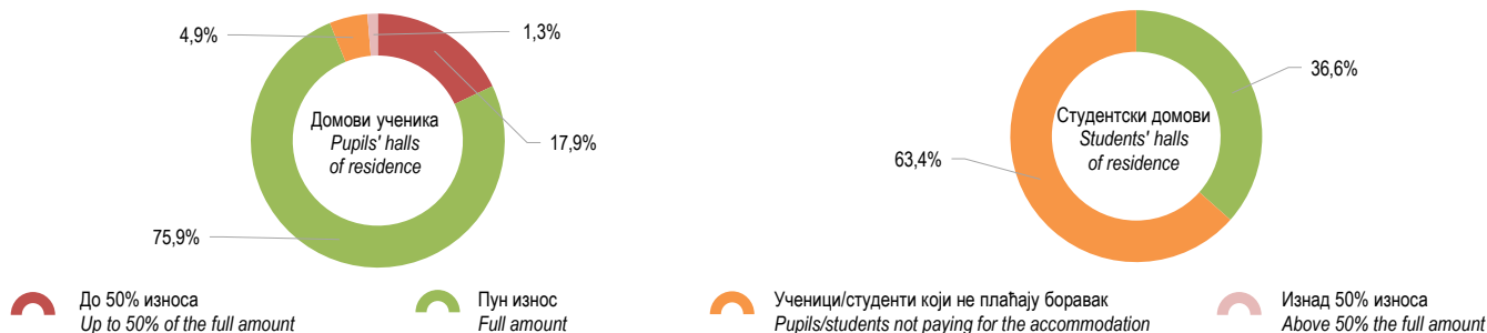
Графикон 1. Ученици и студенти према плаћању боравака у дому, школска 2025/2026. година Graph 1. Pupils and students by payment for the accommodation in halls of residence, school year 2025/2026

Students' halls of residence are institutions providing accommodation to students of high schools, faculties, higher schools and art academies during study time. In addition to accommodation, students can also be provided with food.