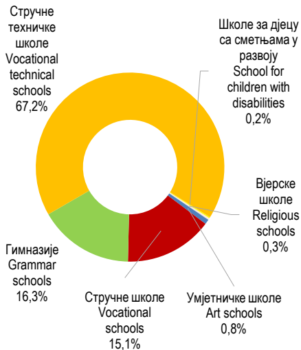
Графикон 1. Ученици средњих школа према врсти средње школе на почетку школске 2024/2025. године Graph 1. Secondary school pupils by type of secondary school at the beginning of the school year 2024/2025