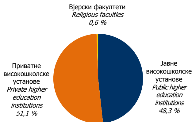
Графика 1. Дипломирани студенти у 2009. години Graphic 1. Graduated students in 2009

The largest number of graduated students was in Social Sciences (78.62%), then Technical and Technological Sciences (9.34%), Medical Sciences (6.21%), Humanities (2.08%), Biotechnical Sciences (1.95%) and Natural Sciences (1.80%).