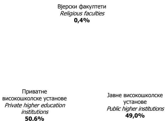
Графикон 1. Дипломирани студенти у 2010. години Graphic 1. Graduated students in 2010

Data in this Release are collected by Statistical form for students who graduated in 2010 (Form ŠV-50).