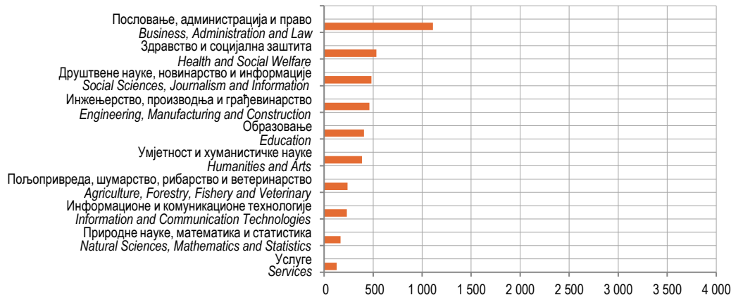
Графикон 3. Дипломирани студенти према области образовања, 2019.

Graph 2. Graduated students by age, 2019