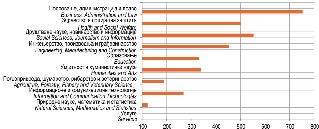
Графикон 3. Дипломирани студенти према области образовања, 2021.

Graph 2. Graduated students by age, 2021