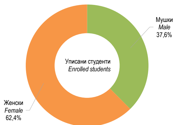
Графикон 2. Уписани студенти према полу у академској 2025/2026. години Graph 2. Enrolled students by sex in the academic year 2025/2026