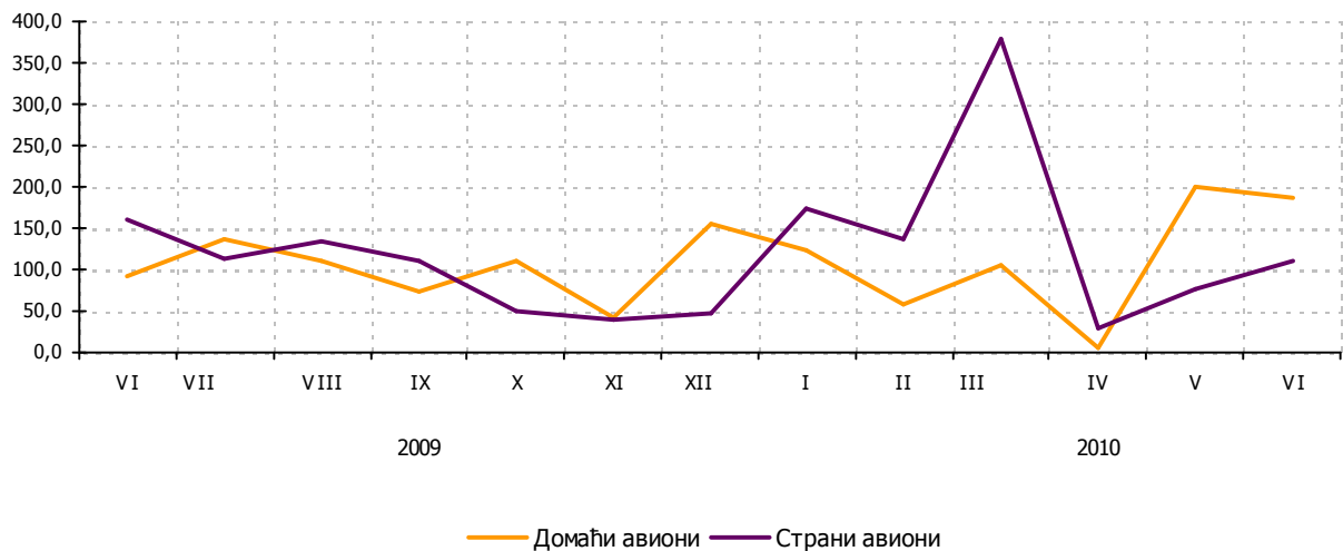
Графикон 2. Промет путника на аеродромима Републике Српске Graph 2. Passengers at airports of Republika Srpska